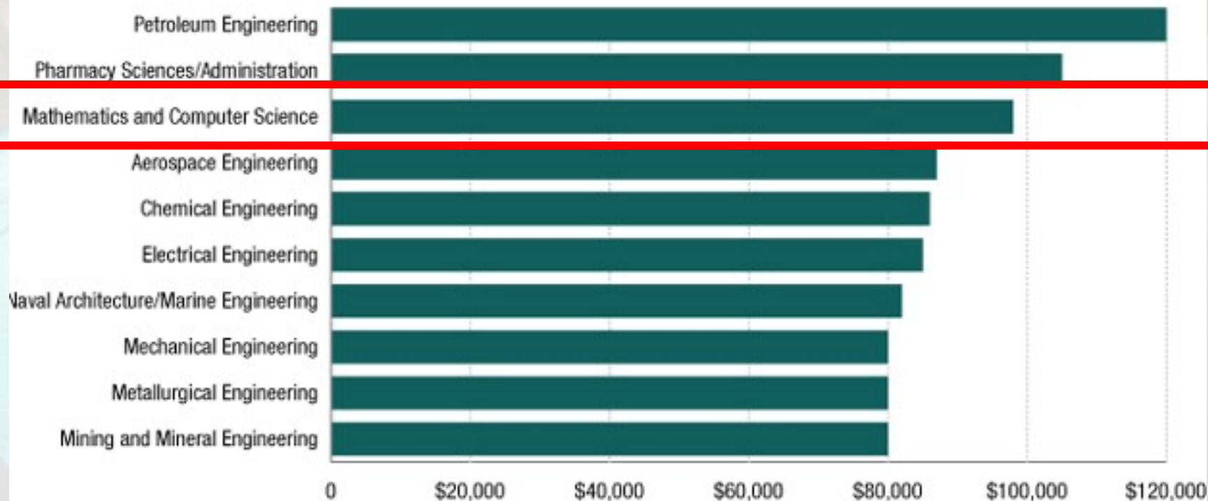
Majors With The Highest Earnings

Las concentraciones de bachillerato con mejores ingresos según Center on Education and the Workforce de la Universidad Georgetown